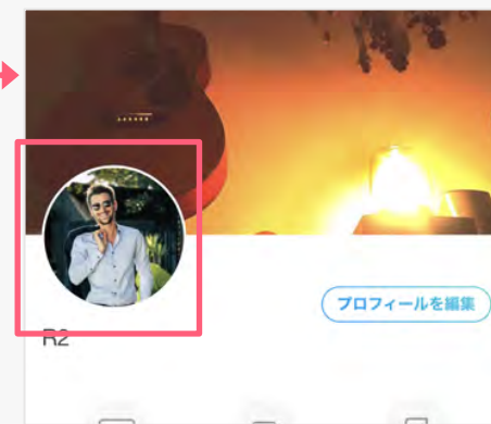
クリエイターページ