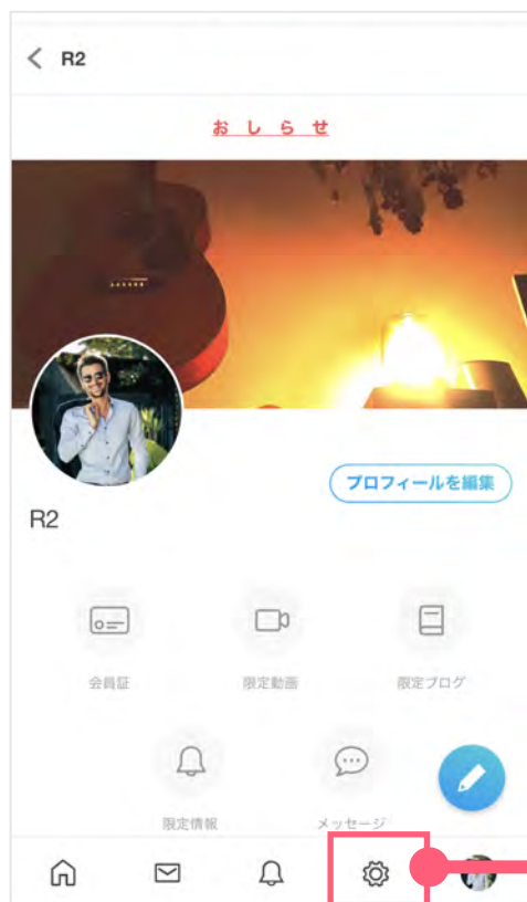
クリエイターページ→設定

登録メールアドレスが現在使用されているものになっているかを下記手順でご確認ください。